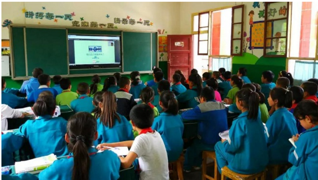
甘肃省崆峒县白坡小学直播课堂

目前，“同一课堂”远程支教已在甘肃省平凉市崆峒区、四川省宜宾县凤仪乡等地多所学校开展，受益学生人数达3114人次，得到了当地校长、老师及学生们的好评。