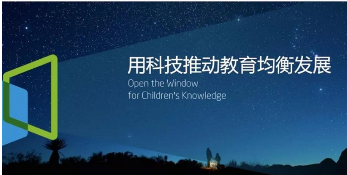
好未来打造的教育公益平台“希望在线”

依托“希望在线”，我们目前已与多个贫困地区政府合作开展了教育信息化项目，并通过实践探索形成了具有灵活性和操作性的教育扶贫模式。在陕西佛坪，我们立足实际调研，依托西安学而思培优就近支持，为其提供县域综合性教育信息化解决方案；在河南嵩县、新疆吉木乃地区，我们通过提供优质的教学资源 and 高效实用的信息化平台应用工具，打造智慧教育体系。