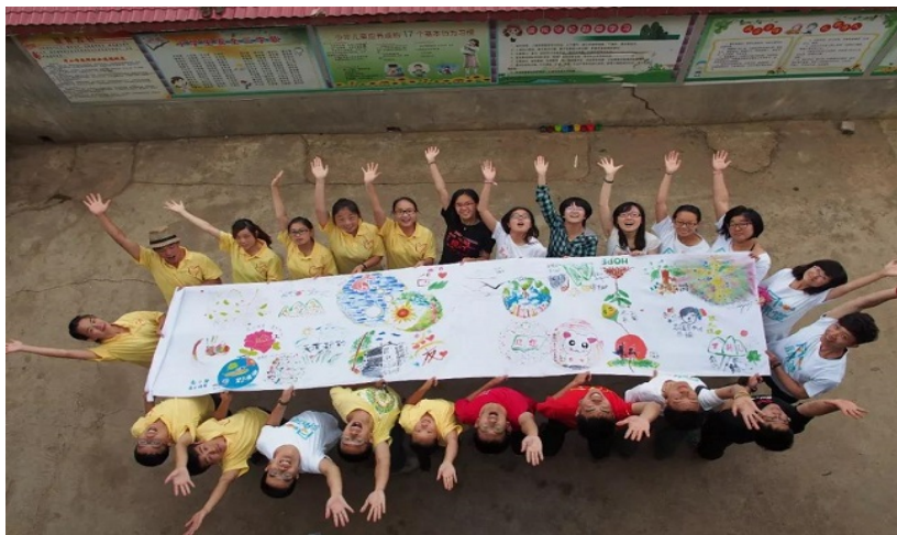
“同一课堂”志愿者大合影

2013年，学而思更名为好未来集团，并在北京市民政局注册成立了好未来公益基金会，着意将集团的教育公益事业导向体系化、专业化的运作。在“帮助更多的人平等享受教育资源”的基金会宗旨指引下，越来越多的好未来人跟随“同一课堂”走进贫困边远地区支教。