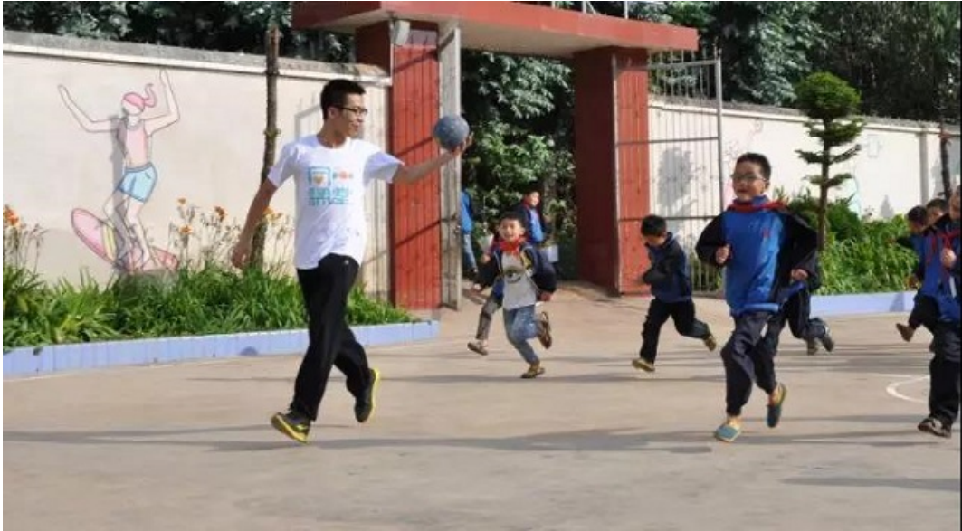
学而思老师在支教课堂中

从“出钱”到“出力”，我们的努力目标，也从让贫困地区的孩子“有学上”转变为能够“上好学”。通过深入当地的支教活动，我们更加清楚地认识到教育资源地域分配不均的现状及边远地区孩子成长面临的挑战，因此也更认真对待自身作为社会教育体系的一分子所应承担的教育服务责任。