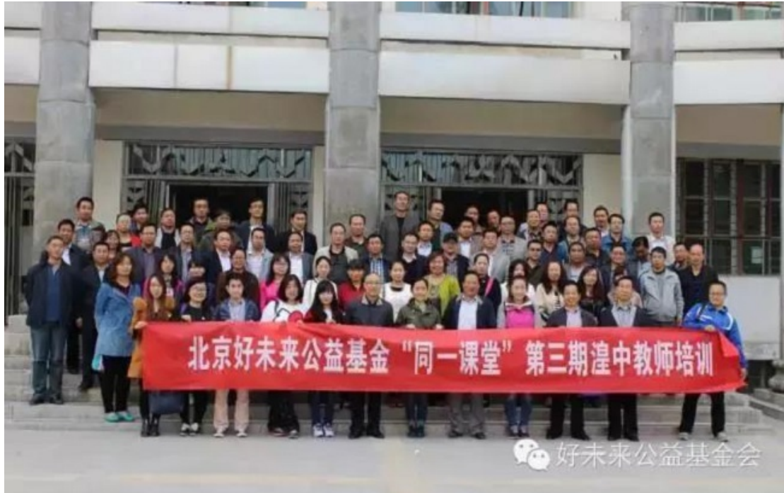
“同一课堂”第三期青海湟中教师培训

2015年，好未来公益基金会启动“同一课堂”乡村教师跟岗研修项目，多位来自四川、陕西、安徽的乡村一线骨干教师来到北京，参与到好未来核心教学部门的日常运作中，在导师一帮一的引领示范下，通过课堂观摩、理论学习、教学体验等研修内容，快速提高教学能力和技巧、有针对性地解决实际教学问题