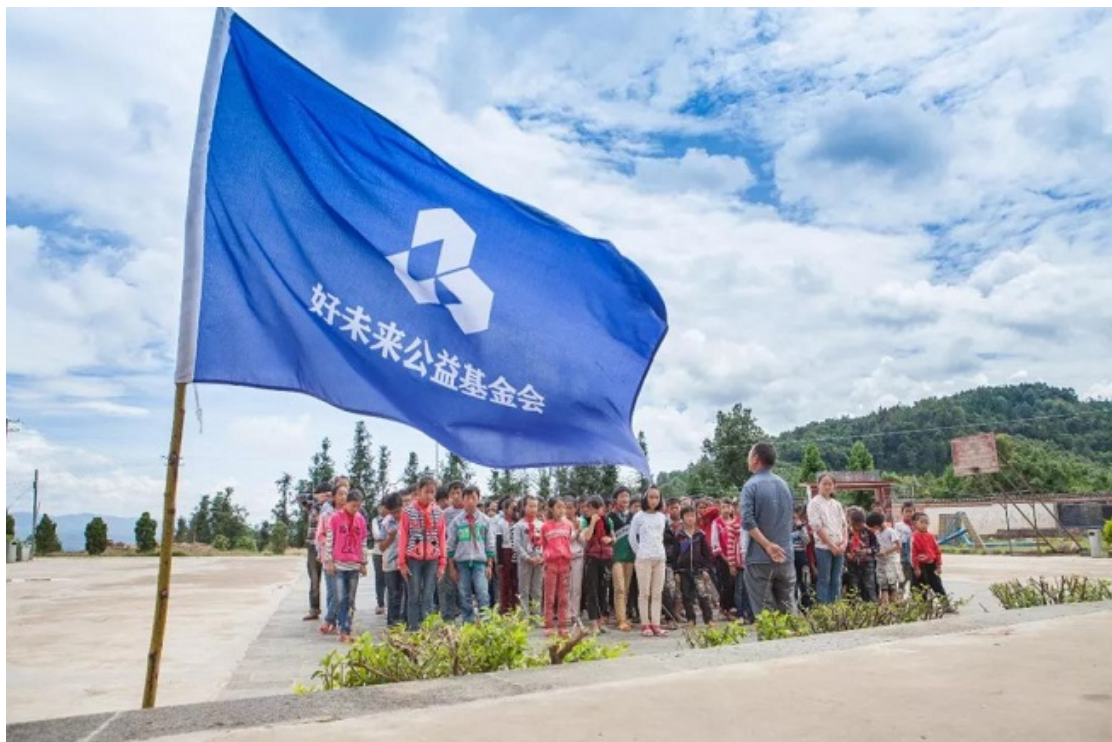
云南保山腾冲县芒棒镇城河完全小学

“做公益不仅是帮助他人，更是完善自我。”在一次次支教和培训、一堂堂的课程和交流中，乡村孩子的欢笑与进步有如阳光温暖着我们的心胸，也鼓舞着我们的公益探索之途。