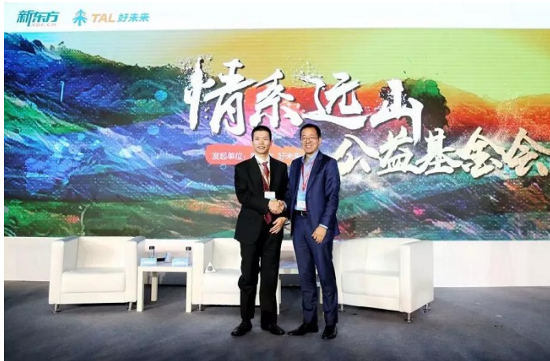
好未来董事长张邦鑫先生与新东方董事长俞敏洪先生

双方优势资源，打造一个开放的教育公益平台，携手更多教育力量，通过科技推动教育公平。