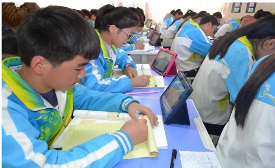
河南嵩县思源实验学校的学生体验好未来“智慧课堂”

依托“希望在线”，我们目前已与多个贫困地区政府合作开展了教育信息化项目，并通过实践探索形成了具有灵活性和操作性的教育扶贫模式。在陕西佛坪，我们立足实际调研，依托西安学而思培优就近支持，为其提供县域综合性教育信息化解决方案；在河南嵩县、新疆吉木乃地区，我们通过提供优质的教学资源 and 高效实用的信息化平台应用工具，打造智慧教育体系。